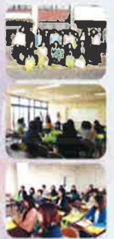
Natural Joy Vision's workshop 20/Nov/2016 , Anjo city